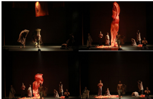
ภาพที่ 7 การแสดงในองก์ที่ 3 ดับไป

ช่วงที่ 5 สงบสุข ถ้าภายในไม่สงบ ข้างนอกก็ไม่สงบ มันเป็นไปได้ เราต่างต้องการความสุข แต่ความสุขจะเกิดขึ้นไม่ได้ ถ้าไม่มีความสุขภายในใจของตน เราต่างส่งพลังความสุขไปให้คนอื่นในที่ที่ไม่สงบได้ การเปลี่ยนแปลงชีวิตจากภายใน คือเส้นทางแห่งความอึดอึดใจ และความสุข ที่ไม่ยึดติด และศรัทธากับเปลือกแห่งธรรม คือ จีวรที่ห่อหุ้มกระพี้ คือ พระภิกษุสงฆ์ แต่จงเข้าใจ และศรัทธาในแก่น คือ ธรรมที่พระตถาคตได้สอนไว้ โดยนักแสดงเดินเข้ามาด้วยลีลาแบบในชีวิตประจำวันด้วยความสงบ รวมถึงนักแสดงอีกกลุ่มใช้ระดับ และการใช้ทิศทาง เพื่อสื่อถึงความศรัทธาและการนพอบที่แตกต่างกันของกลุ่มคน