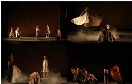
ภาพที่ 5 ภาพการแสดงในองก์ที่ 1 เกิดขึ้น

ช่วงที่ 4 ปินทปาดปฏิสังขตต์ วัตรว่าด้วยเรื่องการครองบาศร และออกบิณฑบาตของพระภิกษุสงฆ์ ตามพระวินัย บัตร ถือเป็นภาชนะที่พระภิกษุสงฆ์ใช้รับอาหาร ถือเป็นบริขาร 1 ใน 8 อย่างที่ขาดไม่ได้ ทั้งยังมีพุทธบัญญัติ ห้ามพระภิกษุสงฆ์ใช้บาตรที่มีขนาดเกิน 11 นิ้ว เนื่องด้วยในสมัยพุทธกาลมีพระภิกษุสงฆ์รูปหนึ่งมีความโลภมากใช้บาตรลูกใหญ่ในการออกบิณฑบาตเพื่อให้ได้อาหารจำนวนมาก และหากบิณฑบาตได้อาหารดีๆ ก็จะนำไปซ่อนไว้ใต้บาตรเพื่อที่จะได้ฉันคนเดียว ถือเป็นกาใช้อำนาจของตนให้ได้มาซึ่งอาหารที่มากแต่เพียงผู้เดียว โดยนักแสดงใช้การแสดงละคร เพื่อเลียนแบบกริยาการอุ้มบาตรของพระภิกษุสงฆ์ และมีการเคลื่อนไหวในรูปแบบนาฏศิลป์ร่วมสมัย โดยใช้เทคนิคการด้นสด (Improvised) รวมถึงการสัมผัสร่างกาย เพื่อใช้ในการสื่อถึงเหตุแห่งภษิตที่สะท้อนถึงการใช้อำนาจในทางที่ผิดกดขี่ข่มเหงผู้อื่นว่า “อำนาจบาตรใหญ่”