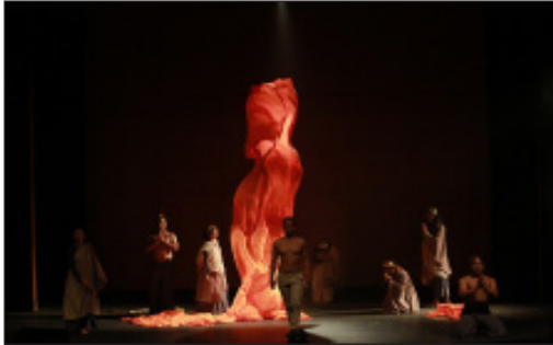
ภาพที่ 3 ภาพการจัดแสงให้อุปกรณ์เด่น