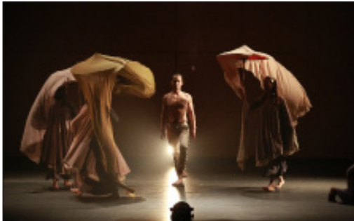
ภาพที่ 4 ภาพการจัดแสงให้แสดงเด่น