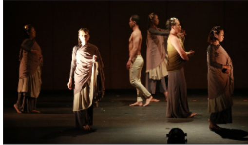
ภาพที่ 2 เครื่องแต่งกายนักแสดง