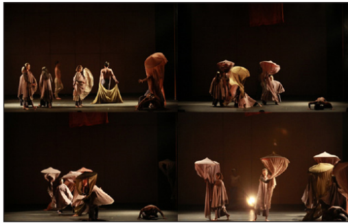
ภาพที่ 6 ภาพการแสดงในองก์ที่ 2 ตั้งอยู่ (ฐาปนีย์ สังสิทธิวิงศ์, ผู้ถ่ายภาพ, 2561)

สนับสนุนส่งเสริมพุทธพาณิชย์ตามกลไกของตลาดในระบบทุนนิยม เช่น การเชิญชวน ขายตรง การโฆษณา เพื่อสร้างกระแสให้เกิดความต้องการ และนำไปสู่เป้าหมาย คือ การหารายได้แสวงหากำไร พุทธพาณิชย์จึงถือเป็น ความลึกลับลึนของความผิดตามพระวินัยของวงการสงฆ์ในปัจจุบัน โดยใช้รูปแบบ นาฏศิลป์ร่วมสมัย เป็นการเคลื่อนไหวแบบบตันสด ซึ่งมักแสดงถึงอุปกรณ์ ที่สื่อถึงสัญลักษณ์ และการแสดงที่เคลื่อนไหวอย่างฉวัดเฉวียน